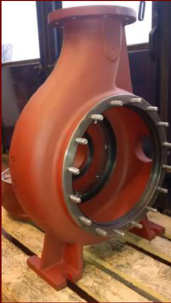
KSB KRK 150-400