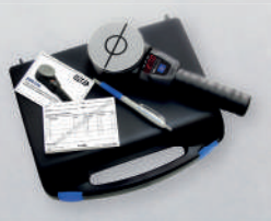
Schließkraftmessung nach ASR A1.7.

Nutzen Sie unseren Wartungsservice, um Ihre Toranlagen betriebsbereit zu halten.